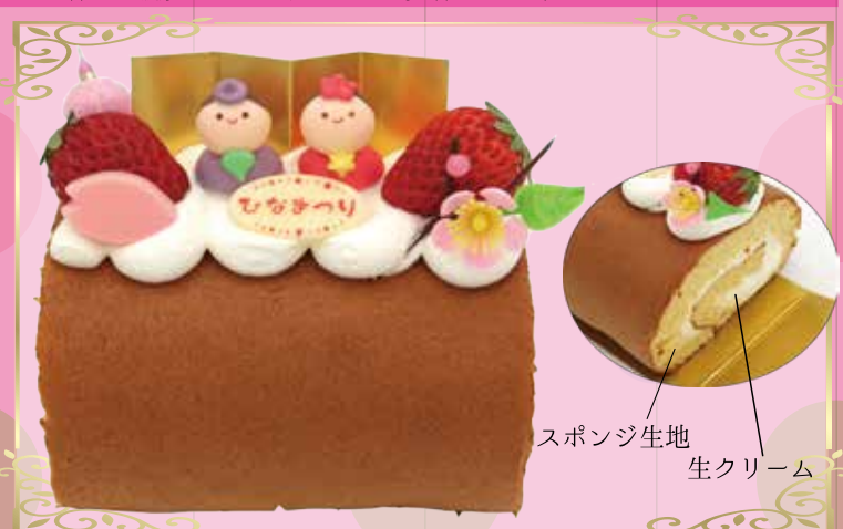
スポンジ生地 生クリーム

ピンク色のスポンジと、抹茶スポンジでカスタードクリームとバターを合わせた濃厚なクリームと、たっぷりの苺を合わせました。